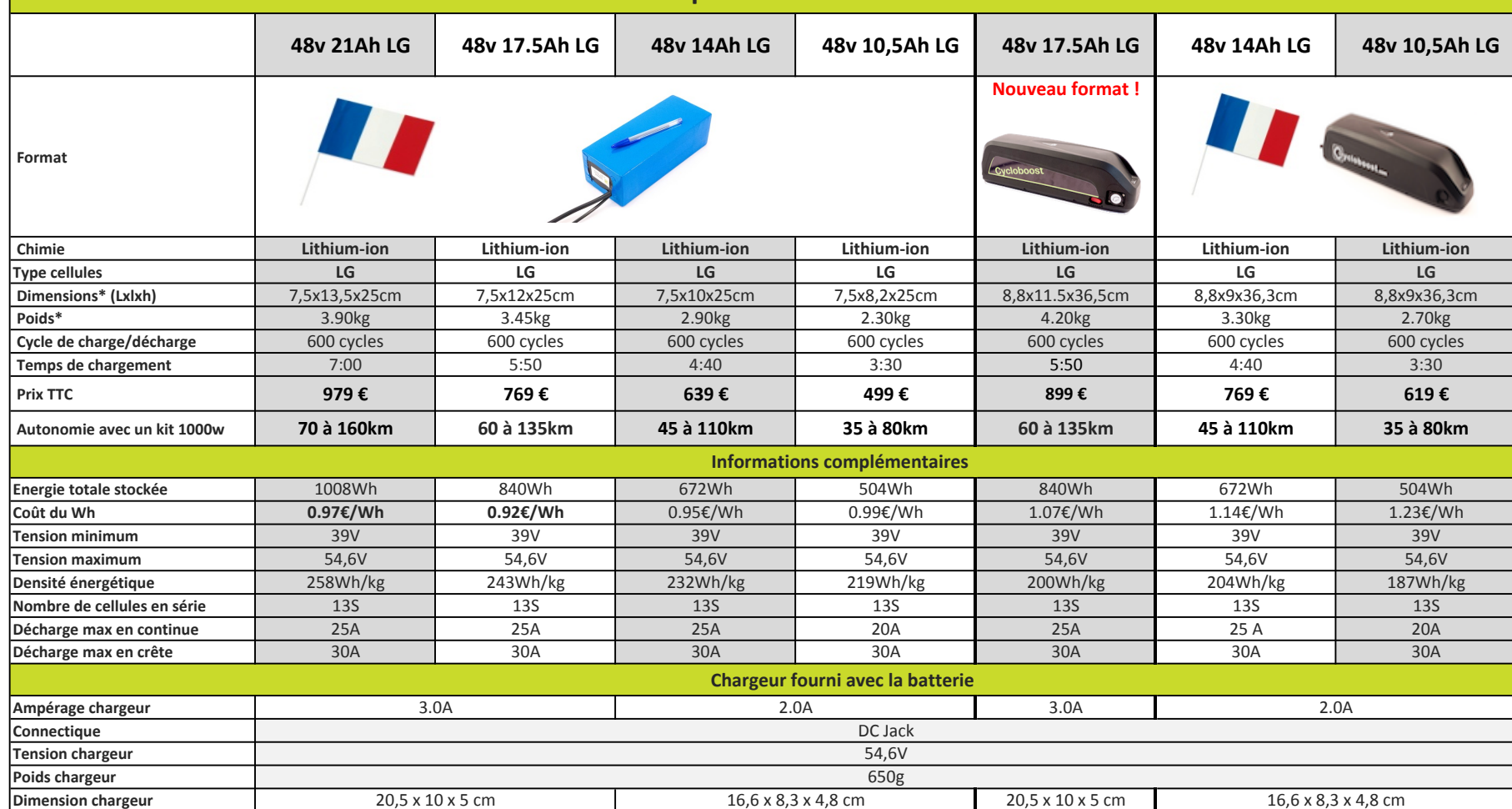
Tableau comparatif des batteries 48v

Tests réalisés sur un terrain plat dans les conditions suivantes :