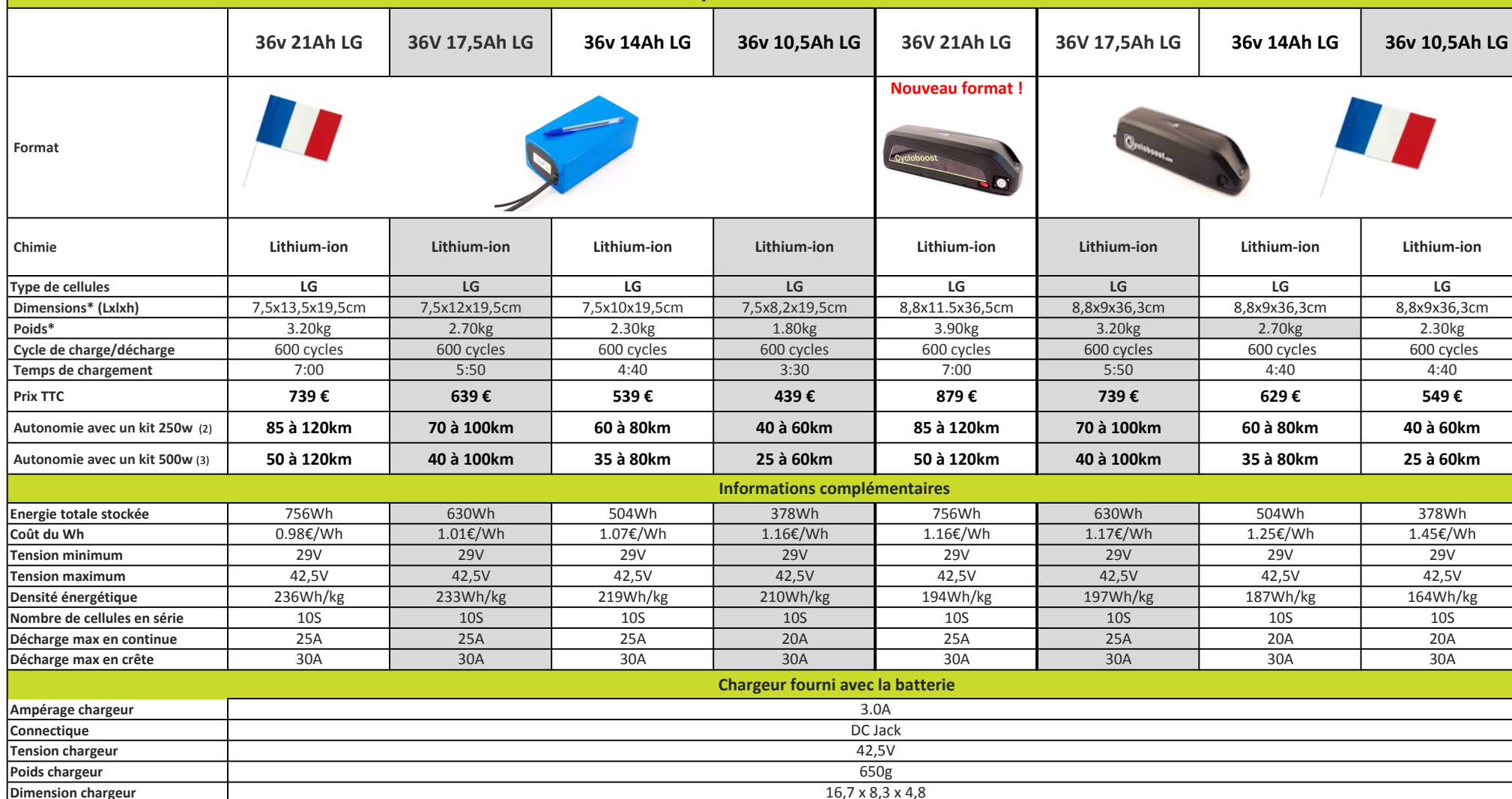
Tableau comparatif des batteries 36v

Tests réalisés sur un terrain plat dans les conditions suivantes :