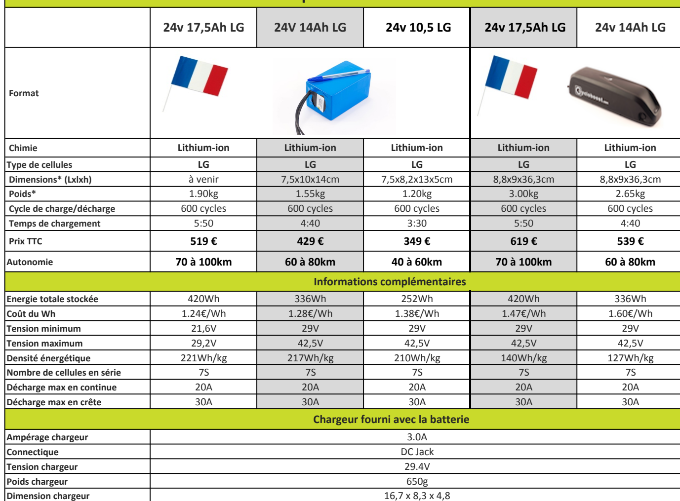
Tableau comparatif des batteries 24v

Tests réalisés sur un terrain plat dans les conditions suivantes :