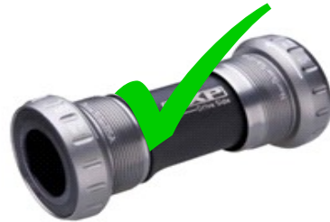
Pédalier à visser avec des roulements externes

Remarque : les vélos équipés de roulements emmanchés de force ne sont pas compatibles, vous ne pourrez pas visser le pédalier du KMP qui est livré avec le kit.