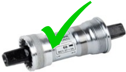
Pédalier à visser type BSC avec des roulements internes