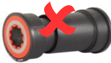
Roulements type Press Fit

Remarque : les vélos équipés de roulements emmanchés de force ne sont pas compatibles, vous ne pourrez pas visser le pédalier du KMP qui est livré avec le kit.